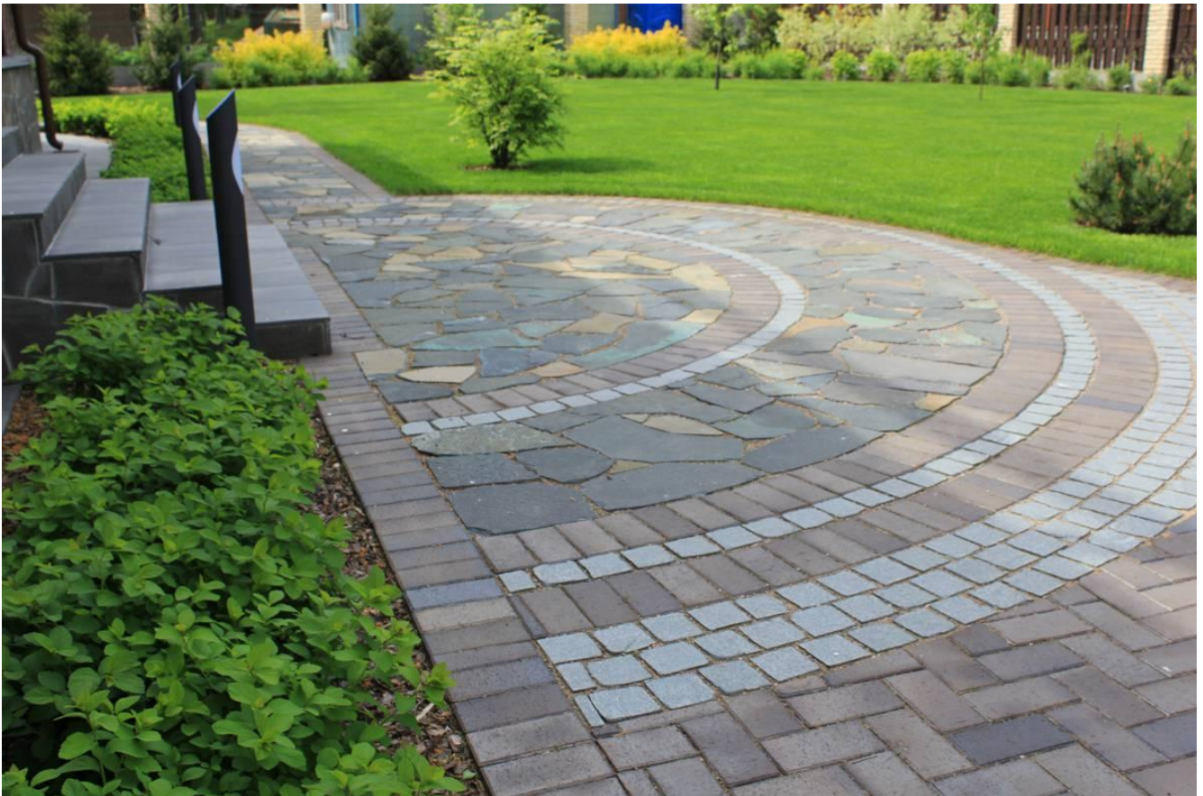
Ремонт твердых покрытий аллей