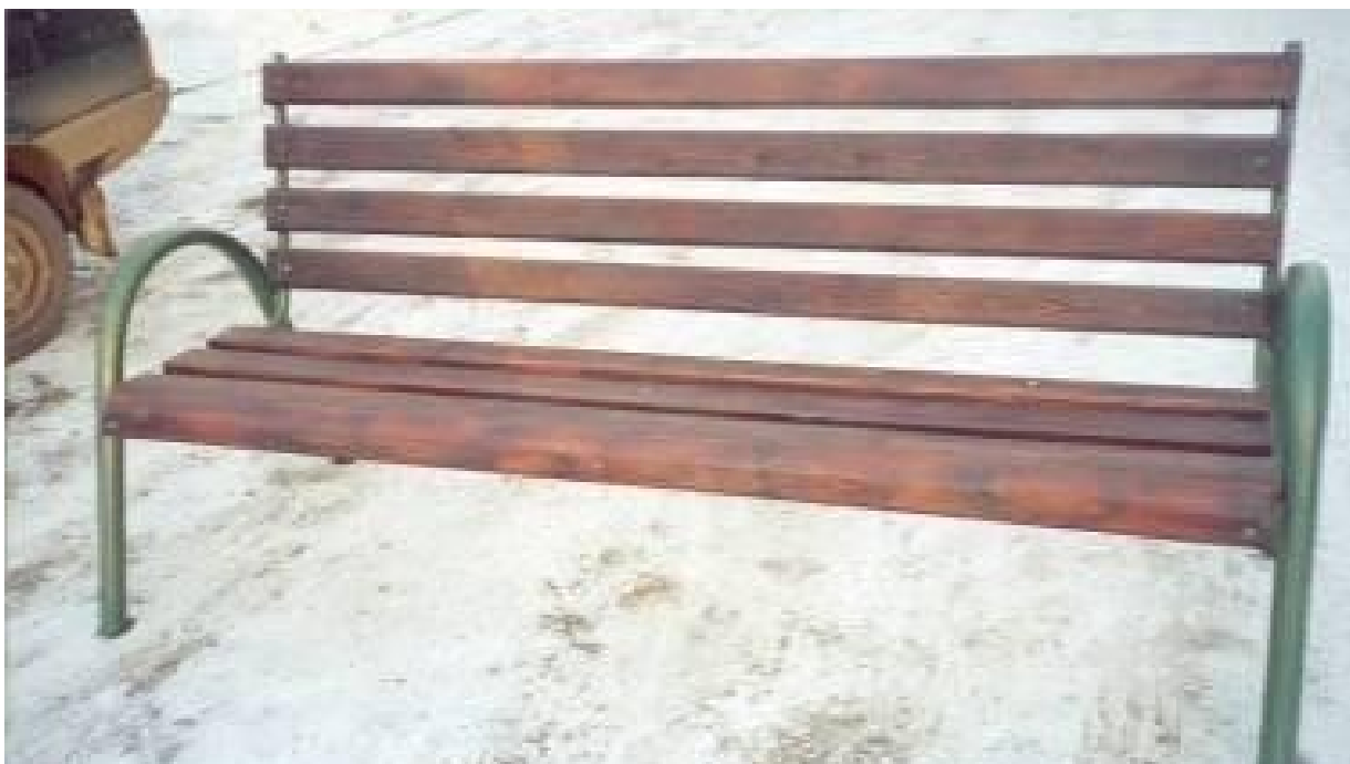
Скамья для установки