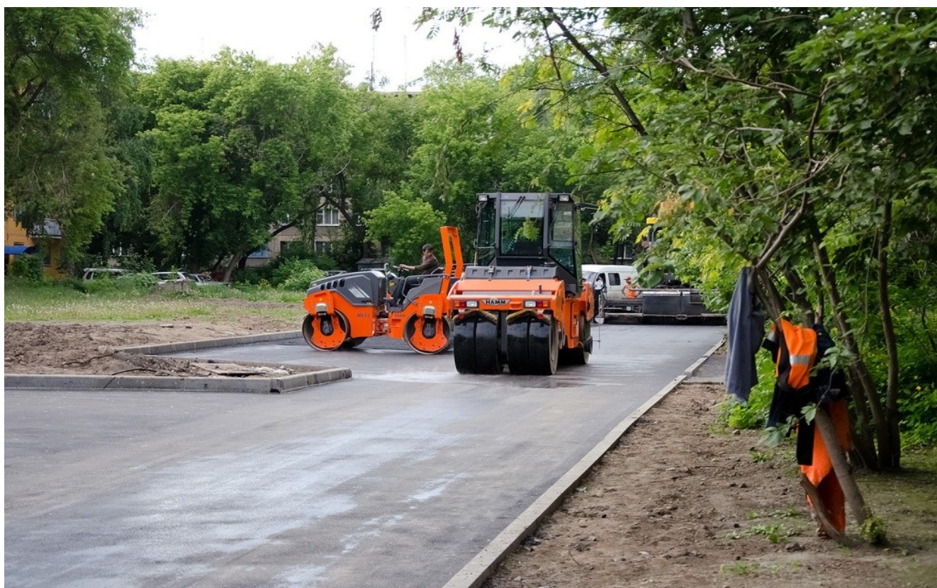
Ремонт дворовых проездов